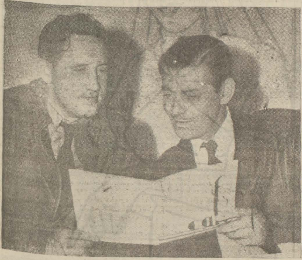
Clark Gable ile Spencer Tracy bir arada

Geçenlerde bu sütunlarda meşhur Amerikan sinema san'atkarlarından Clark Gable'in hayatının bir kısmını nakletmiştik. Bu ilk kısımda onun emeline muvaffak oluncaya kadar neler çektiği anlatılıyordu. Bugünkü kısımda san'atkarın artık şöhret ve muvaffakiyet merdiveni ne ayağına atmış olarak buluyoruz.