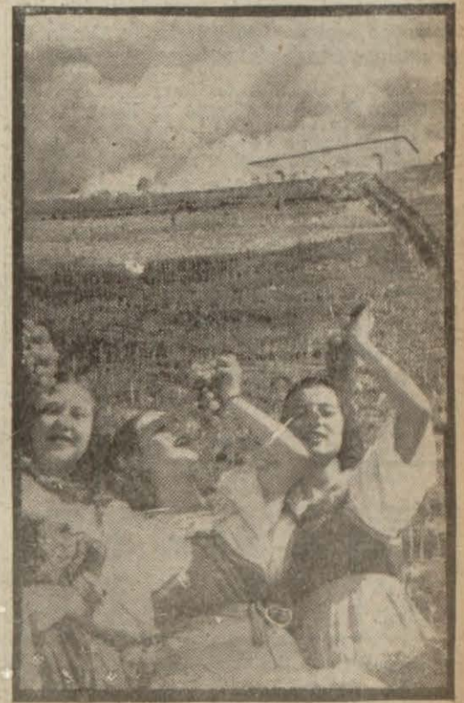
İtalyan köylü kızları

Fransızlar ve İtalyanlar kış, harbin bitip bitmiyeceği meselesinin dahi harçinde olarak büyük bir endişe ile beklemektedirler. Hayvanatın Alman ordusu tarafından (Devami 2 nci sayfada)