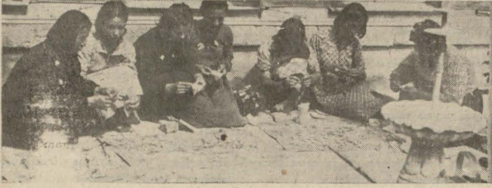
Kozacılık kursu kız talebeleri fenni çekilde hastaliksız tohum istihsaline ve paketleme ameliyesine çalışırken

İlkbaharın yağışlı gitmesi pancar zeriyağını ve sökülme işini geciktirdi - Kozacılık kursu bitti